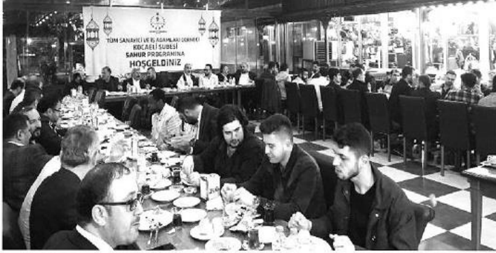
Tüm Sanayici ve İş Adamları Derneği (TÜMSİAD) Kocaeli Şubesi, geleneksel Sahur programını yoğun bir katılımıyla gerçekleştirdi.